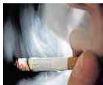
Einfach aufhören? Viele schaffen es nur mit Hilfe von Profis.

Aufhören wollen viele, doch alleine schaffen es nur wenige: Sehr erfolgreich sind professionelle Kurse zur Tabakentwöhnung, die von einem erfahrenen Lungenfacharzt und einem Psychologen begleitet werden. Dafür finden am Donnerstag, 3. März, und am Donnerstag, 10. März,